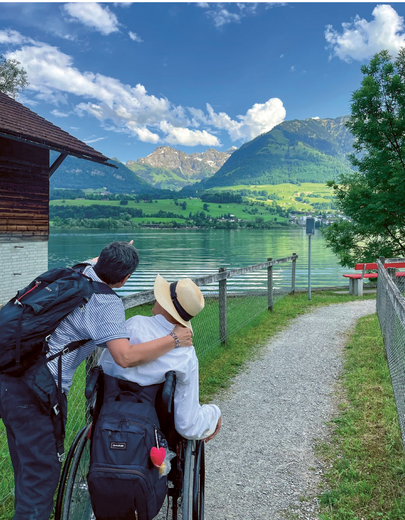
Ferien am Sarnersee