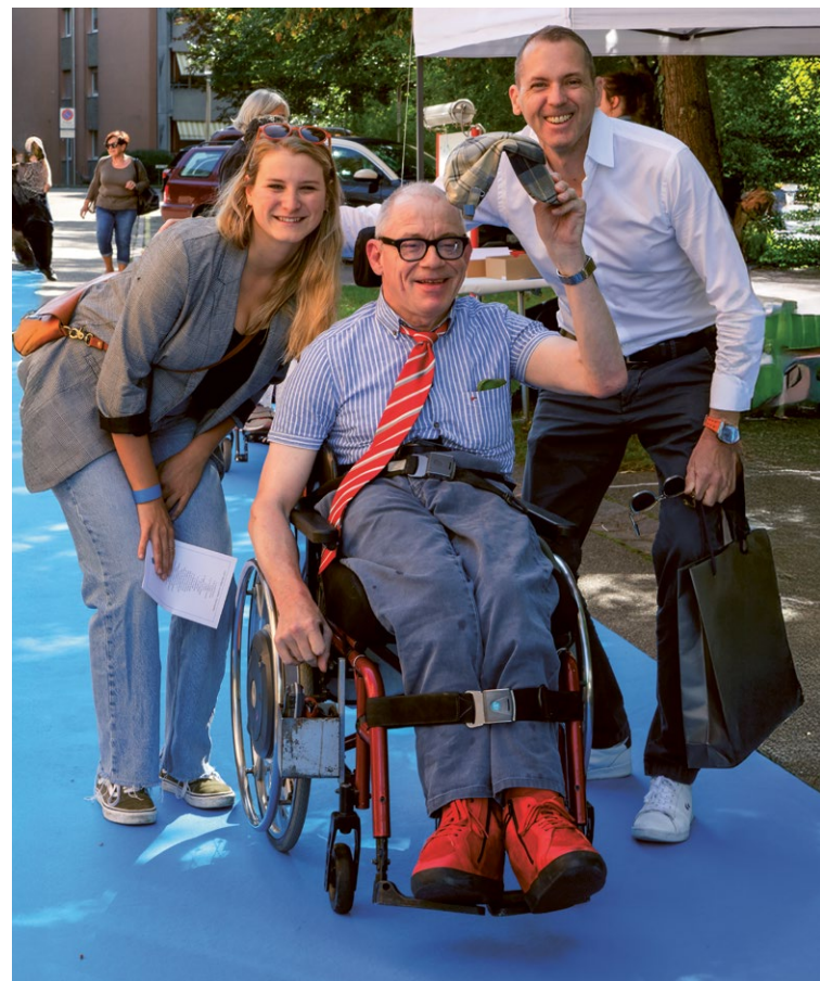
Begrüssung am Jubiläumsfest