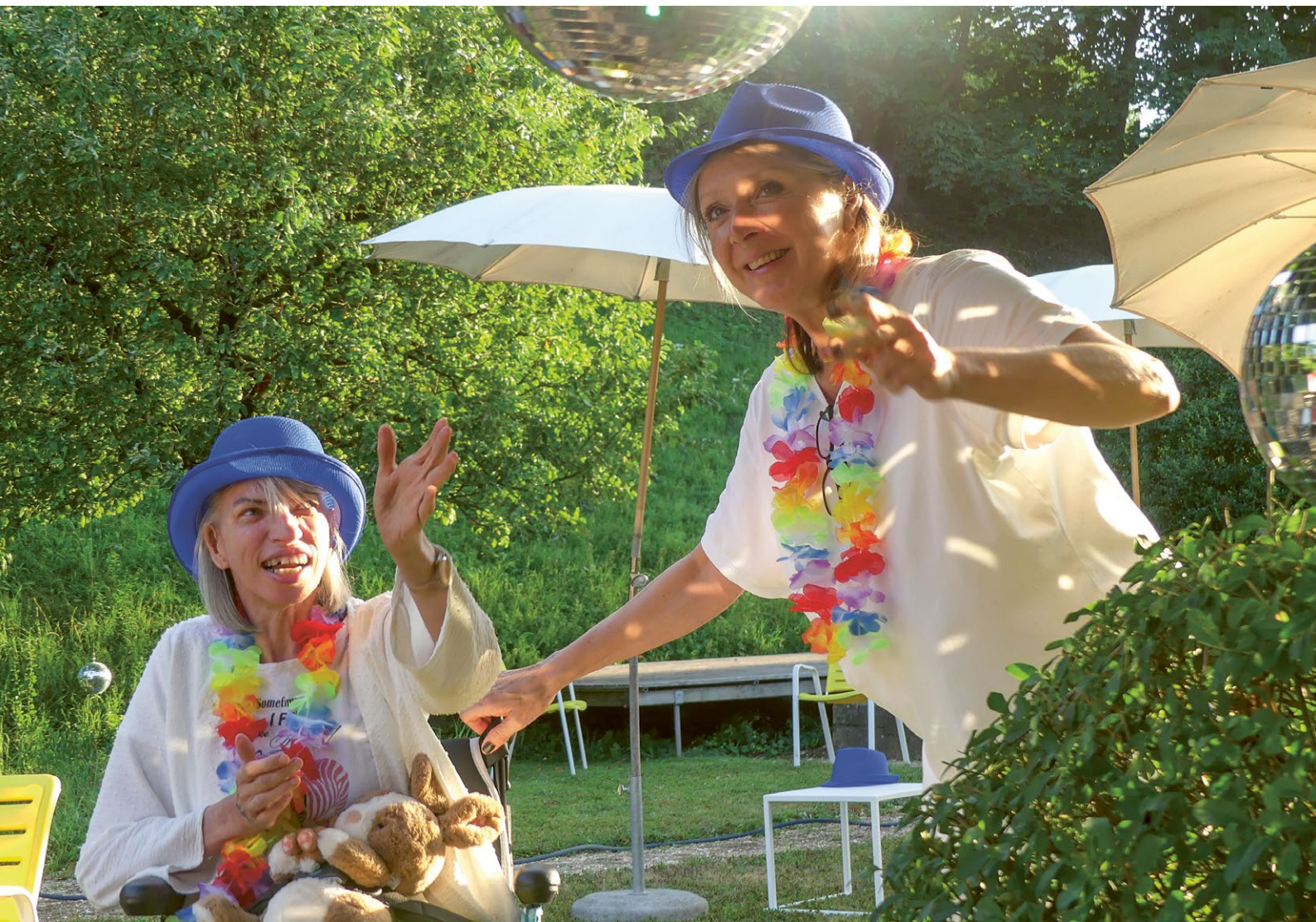
Jubiläumsevent: «OpenAir Sommer-Disco»